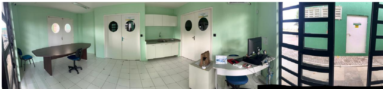
ÁREA INTERNA ONDE DEVERÁ SER INSTALADO OS EQUIPAMENTOS